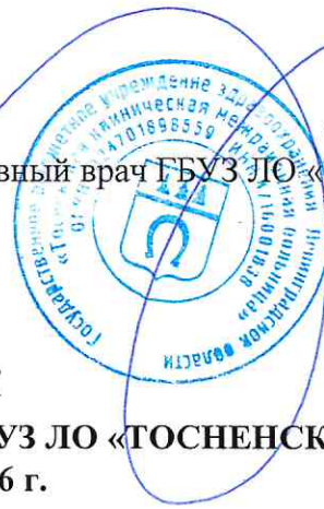
ГРАФИК выезда мобильного комплекса ГБУЗ ЛО «ТОСНЕНСКАЯ КМБ» на апрель 2026 г.