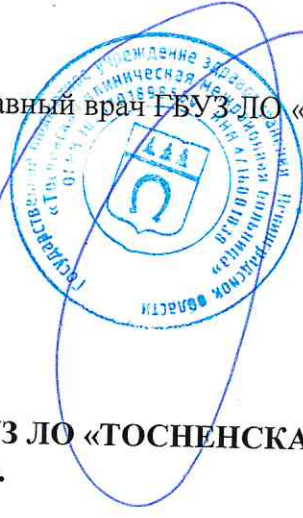
ГРАФИК ВЫЕЗДА МОБИЛЬНОГО КОМПЛЕКСА ГБУЗ ЛО «ТОСНЕНСКАЯ КМБ» на июнь 2026 г.