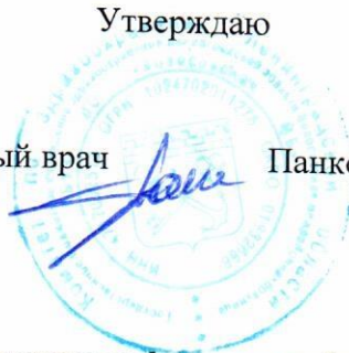
График выезда передвижного флюорографа на апрель 2026 год