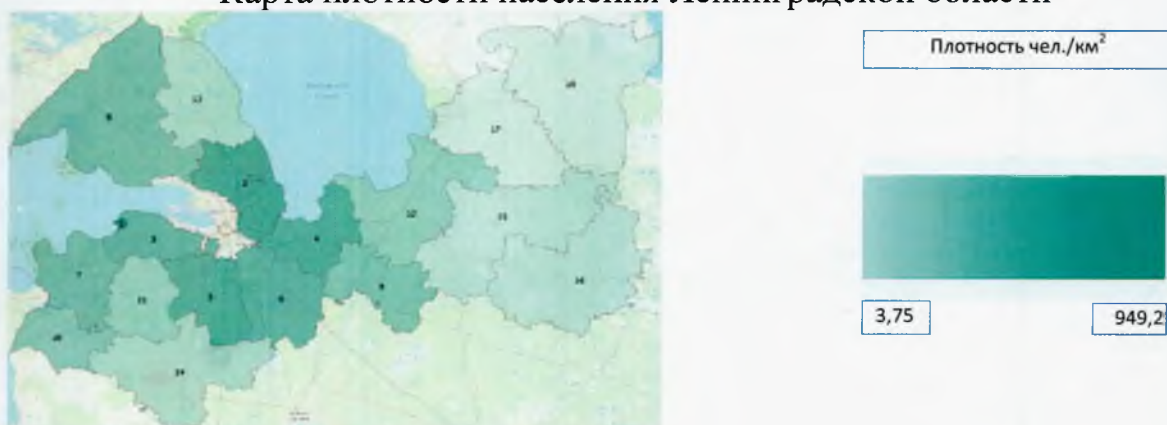
Карта плотности населения Ленинградской области

Самым густонаселенным в Ленинградской области является Сосновоборский городской округ (плотность населения – 949,22 чел./ кв. км (68344 чел. на 72 кв. км). Самый малонаселенный район Ленинградской области – Подпорожский муниципальный район (плотность населения – 3,67 чел./ кв. км (28263 чел. на 7705,5 кв. км).